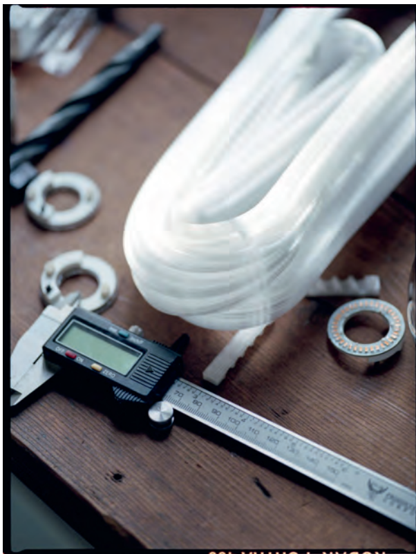
Le 87 en cours de production dans l'usine de verre de Vancouver, au Canada.