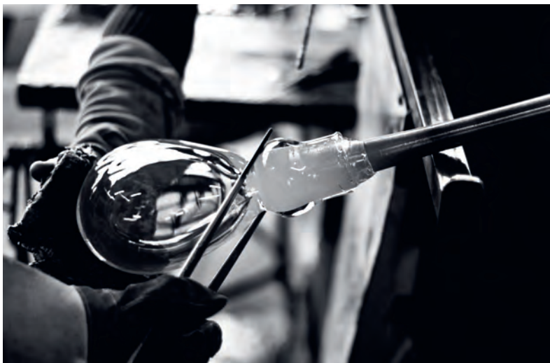
La série 28, comme les autres produits Bocci, est produite dans l'atelier de soufflage de verre basé à Vancouver, au Canada.